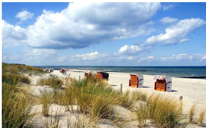
Strand Insel Poel