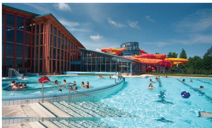
Wonnemar - Schwimmbad, Saunalandschaft