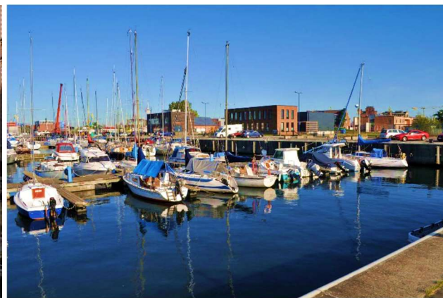
Segelyachten im Westhafen